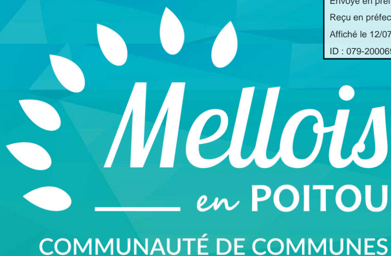
Schéma de cohérence territoriale du Mellois en Poitou

ID : 079-200069755-20190708-DEL_2019_186-DE